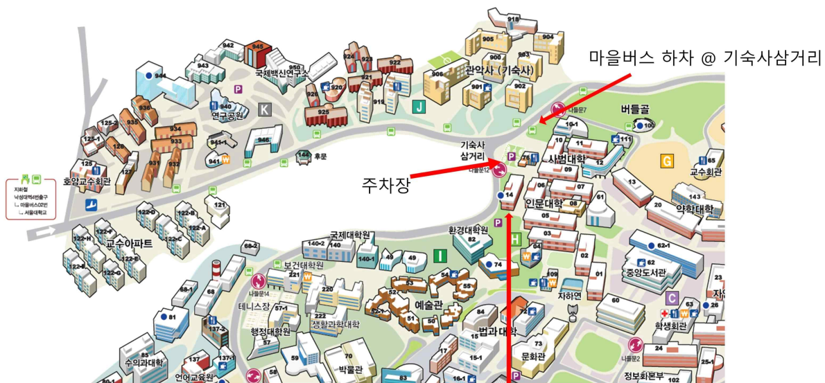
2023 한국음성학회 봄 학술대회 장소: 서울대학교 14동 B101호 강당